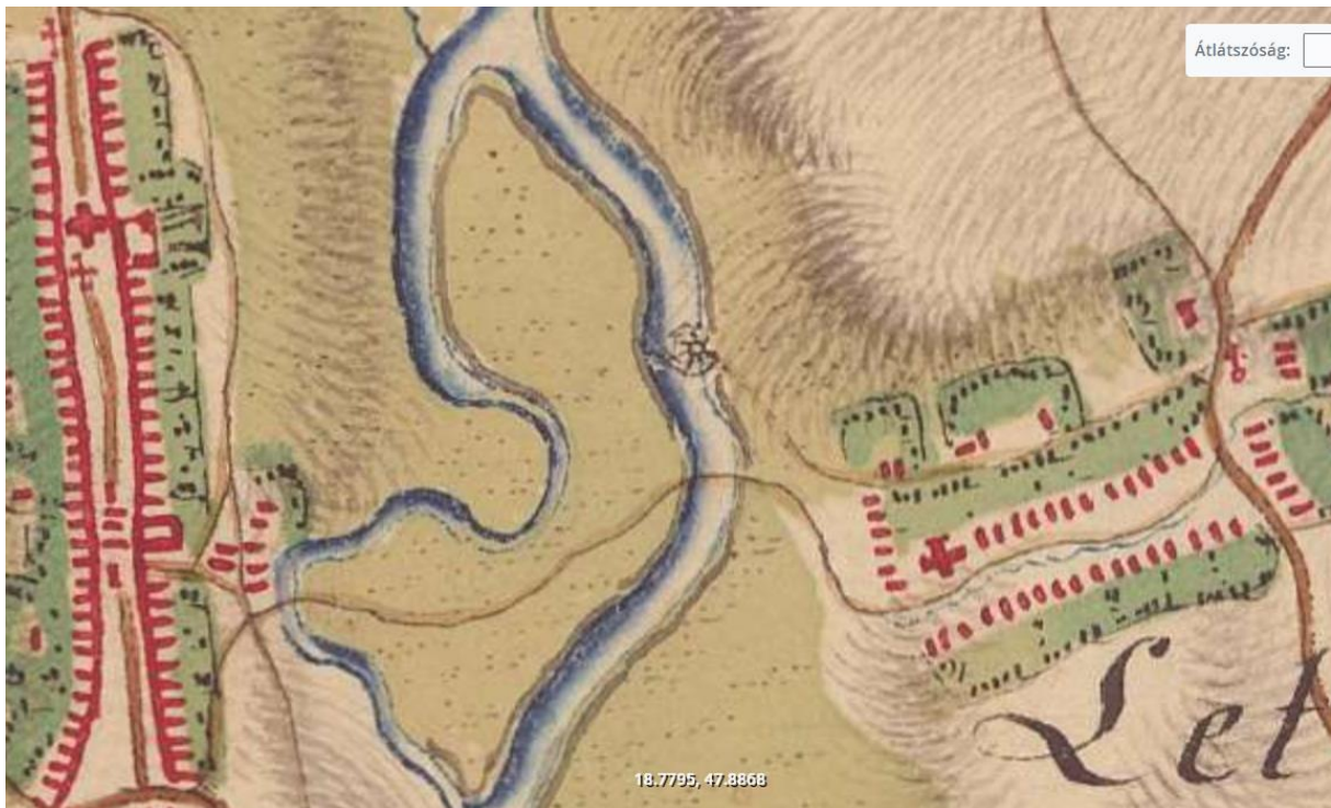
Letkés és Ipolyszalka az első katonai felmérésen