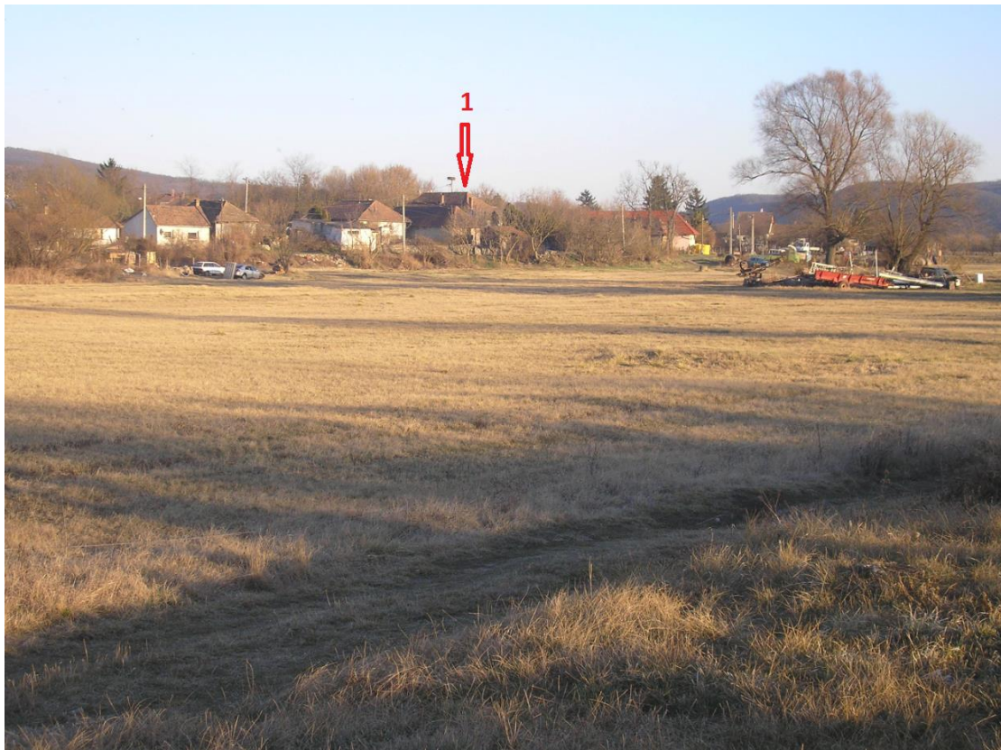
Az előző ponton állva délkelet felé fotózva a területünkkel keletről szomszédos ártér és a terasz lejtőjére épült házak. 1- A teraszon levő MRT 9. 16/14. lelőhely (Korongi-part).