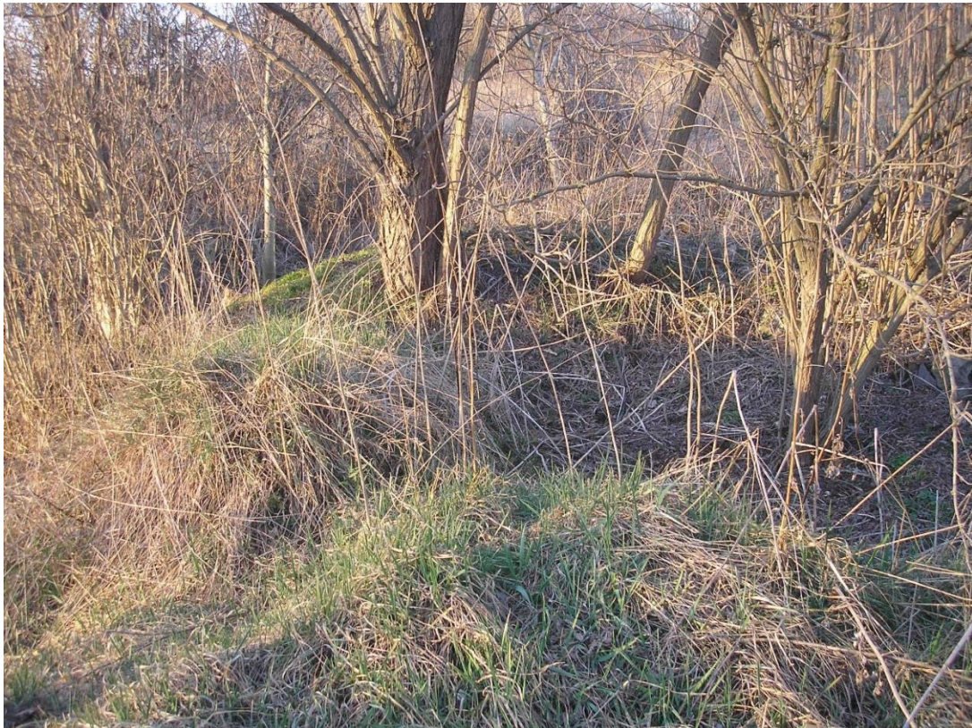
A terület északi részén, a Diófa u. északi házsorától nyugatra kb. 20 m-re állva észak felé fotózva. Bozótban benőtt törmelék.