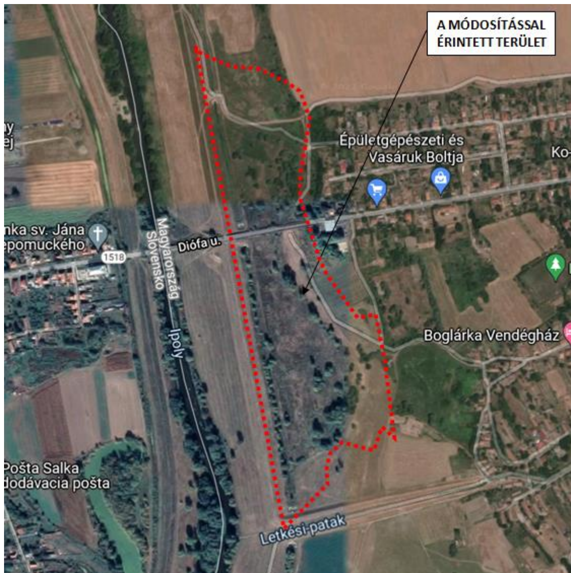
A tervezési terület légifotója

A változtatási terület északkeleti, keleti és délkeleti határa nagyrészt az Ipoly szabályozás előtti főmedrének nyugati szélével esik egybe. Ez a korábbi főmeder látható az első katonai felmérésen (a letkési térképlap 1783-ban készült). A harmadik katonai felmérésen (1869 és 1887 közt készült) ezzel nagyjából megegyező a főmedernek a változtatási területre eső nyomvonala. A második katonai felmérés ugyanezt a folyószakaszt kis eltéréssel ábrázolja, de ez a korábbi és a későbbi felmérések alapján a térképezők pontatlanságának a számlájára írható.