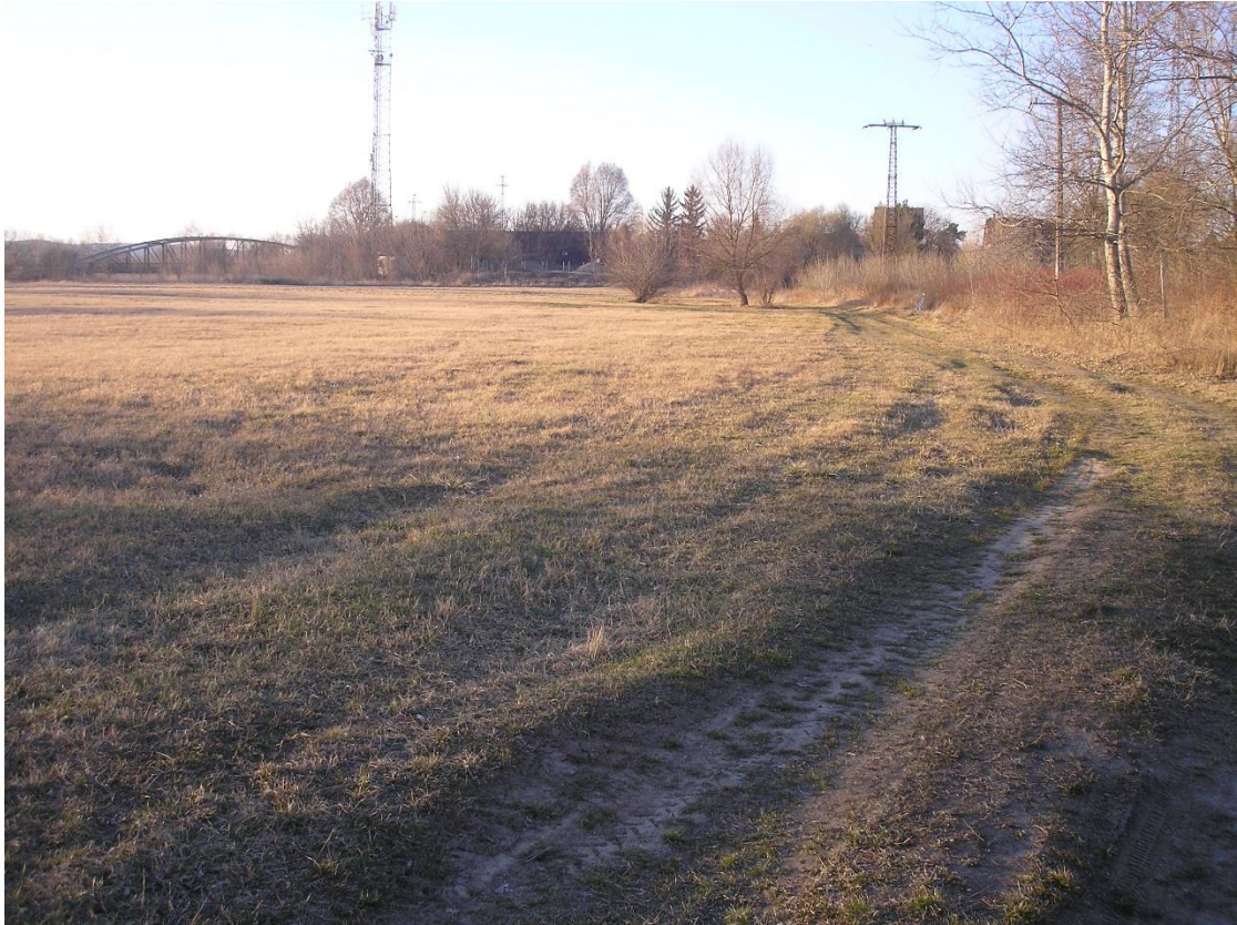
A 106/3. hrsz. északi részén állva észak felé fotózva. A területünk É-D-i határa kb. a kép közepén húzódik. Középen a távolban a határállomás teteje, jobbra a Diófa u. nyugati vége.