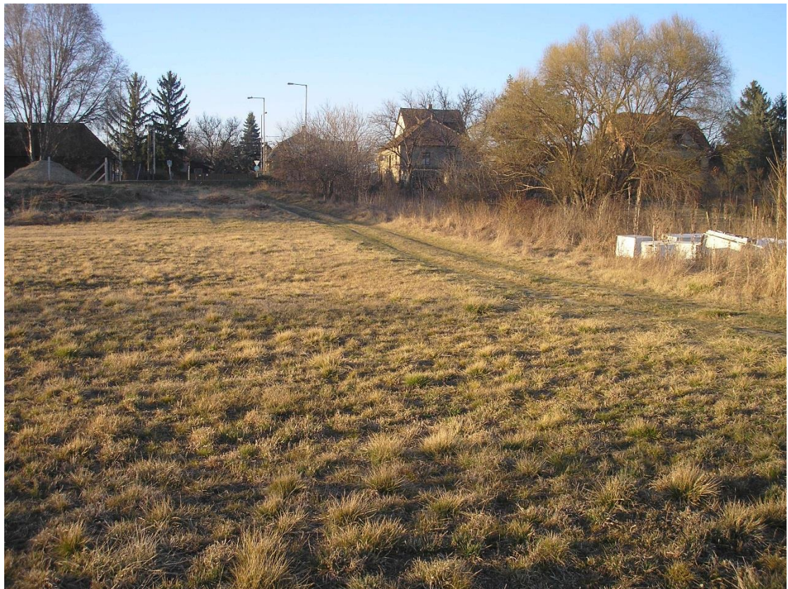
A változtatási terület keleti szélétől kb. 30-40 méterre keletre állva és észak-északkelet felé fotózva. Bal szélén a határátkelő épülete, jobbra a Diófa u. nyugati vége.