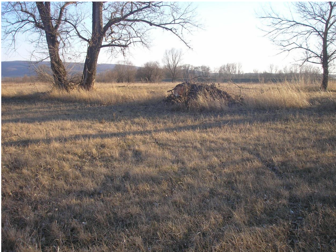
Az előző ponton nyugat-délnyugat felé fotózva. Kb. 150-200 méterre látható a gát.