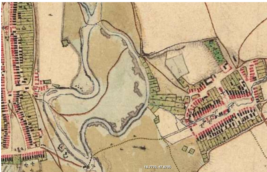
A változtatási terület a második katonai felmérésen