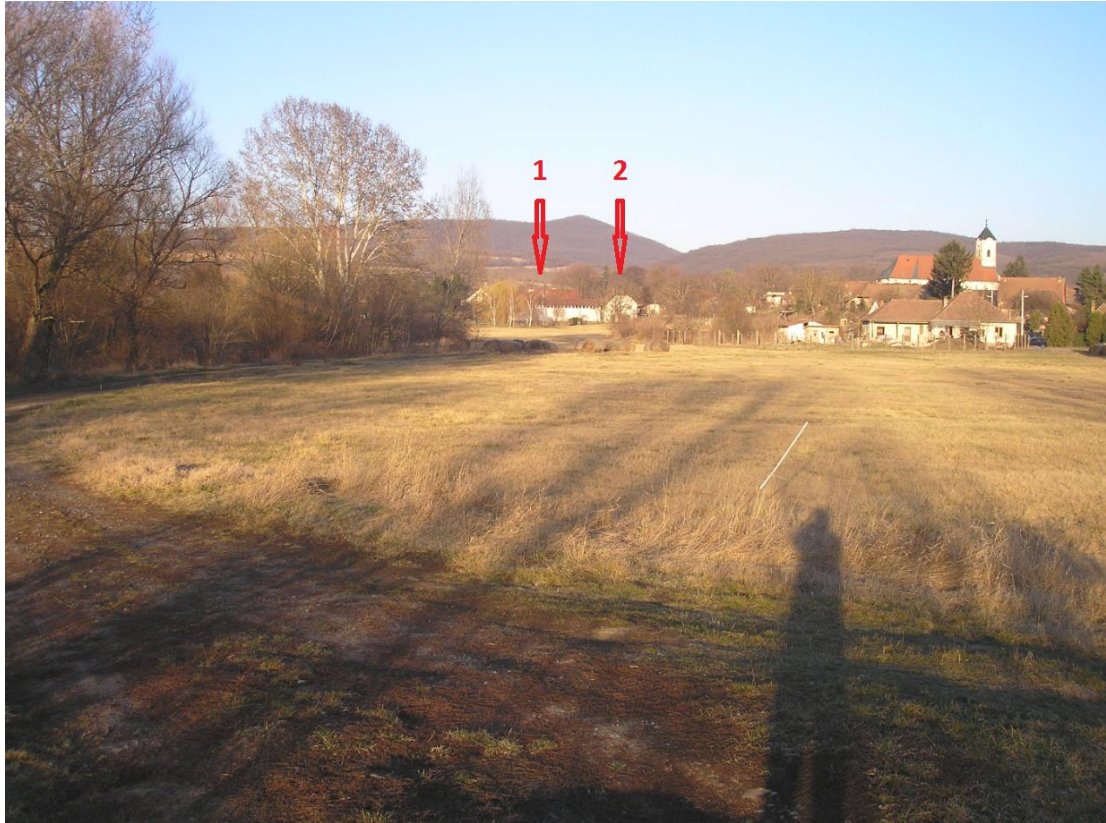
A 124. hrsz. déli részén állva kelet felé fotózva a területünkkel szomszédos árteret. 1 – az árterben épült tornaterem, 2- a magaslaton lévő iskola közelében lévő MRT 9. 16/5. lelőhely.