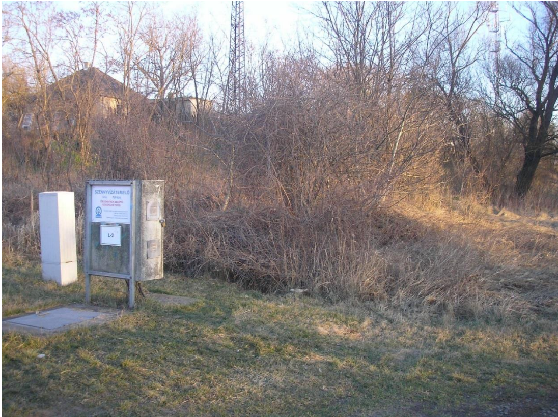
A változtatási terület északi részén a partfaltól 20 méterre nyugatra, a 05/8. hrsz. déli csücskén az egykori ártérben állva DK felé fotózva látszik az Ipoly u. északi házsorának a vége és az előtérben levő, benőtt betontörmelékbeli álló szemétkupac.