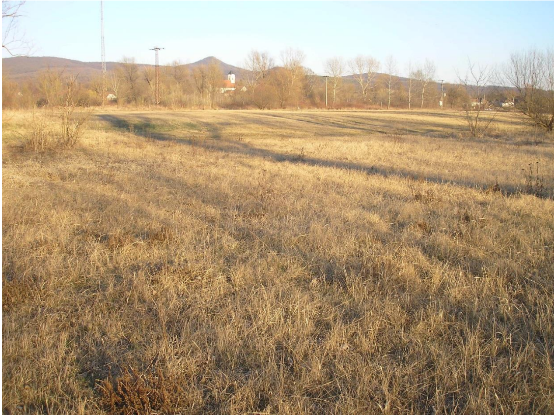
A terület déli részén a 705. hrsz. közepe táján állva délkelet felé fotózva. A fotózási ponttól kb. 30 méterre keletre ér véget a változtatási terület.